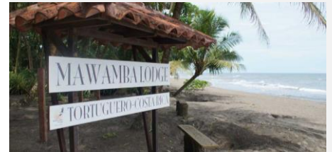
Mawamba Lodge, Tortuguero National Park