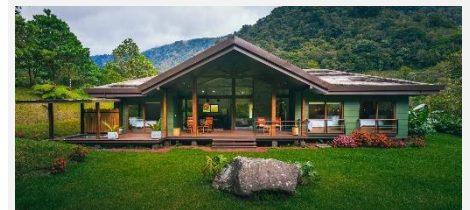
El Silencio Lodge &amp; Spa, Bajos del Toro