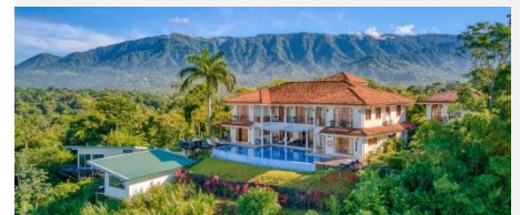
El Castillo, Playa Tortuga