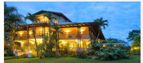
Casa Turire Hotel & Restaurants, Turruialba