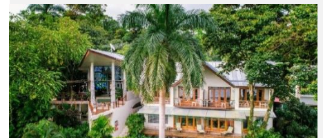
Si Como Resort, Manuel Antonio National Park

Ihre Ferien verdienen eine persönliche Beratung. Wir haben Mittel- und Südamerika mehrmals selbst bereist. Gerne geben wir Ihnen meine Erfahrung unverbindlich weiter.