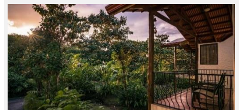
Casa Luna &amp; Spa, La Fortuna