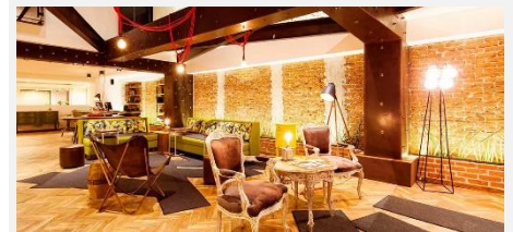
Hotel Presidente, San José